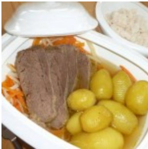
An den gedeckten Tisch setzen und genießen

An einer Sache hat sich in den vergangenen Jahren nichts geändert. Auf der mehrstündigen Autofahrt zu meiner Mutter klingelt mein Handy auf halber Strecke. Ich sehe am Display die vertraute Rufnummer und bevor ich mich melde (natürlich mit Freisprechanlage), weiß ich schon, welche Frage sie mir stellt: „Was möchtest Du essen?“